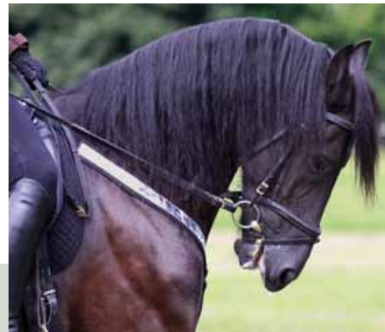
Die „Rollkur“ zwingt ein Pferd in eine gesundheitsschadende Haltung