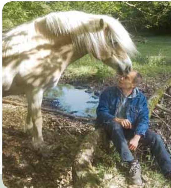
Gemeinsamer Weg mit Verständnis auf beiden Seiten

Was können wir Menschen also tun, wenn wir nachhaltig und langfristig glücklich mit unserem Partner Pferd leben wollen?