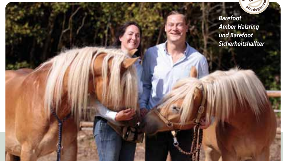
Zwei junge Pferde zufrieden und motiviert mit Ihren Ausbildern

Eine vertraute und harmonische Verbindung zu unserem Partner ist nur dann möglich, wenn wir uns der Wirkung unserer feinsten Gefühle und Körpersignale absolut bewusst sind und frei danach handeln.