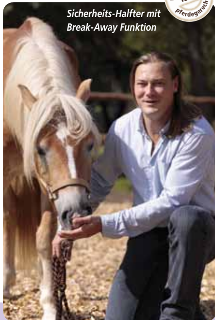
Sicherheits-Halter mit Break-Away Funktion

Belohnungen geben dem Pferd ein positives Feedback: „Das hast du gut gemacht!“