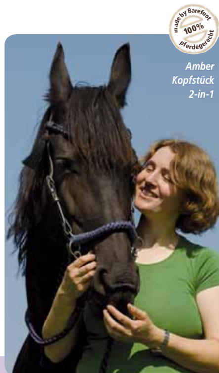
Amber Kopfstück 2-in-1

Wer eine innige lebenslange Freundschaft sucht, der muss es seinem Pferd auch mit seiner aufrichtigen Anerkennung beweisen. Der Beginn einer artübergreifenden Freundschaft beinhaltet schon, sich einmal bewusst die Zeit zu nehmen, herauszufinden, an welchen Körperteilen das eigene Pferd wirklich gerne berührt werden möchte. Gerät es in Verückung, wenn wir sanft seine Schweifrübe massieren oder kräftig den Unterhals kraulen? Beginnt es seinerseits vielleicht auch uns zärtlich zu berühren, wenn wir das Knabbern eines Artgenossen am Widerrist imitieren? Nur wer sich authentisch mit dem Pferd freut und es ohne Forderungen wertschätzt, der wird einen wirklichen Freund gewinnen.